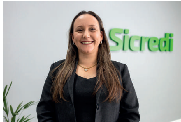
Gerente da Sicredi Guararema

- Comprovantes de contribuições de Previdência Privada na modalidade Pro-