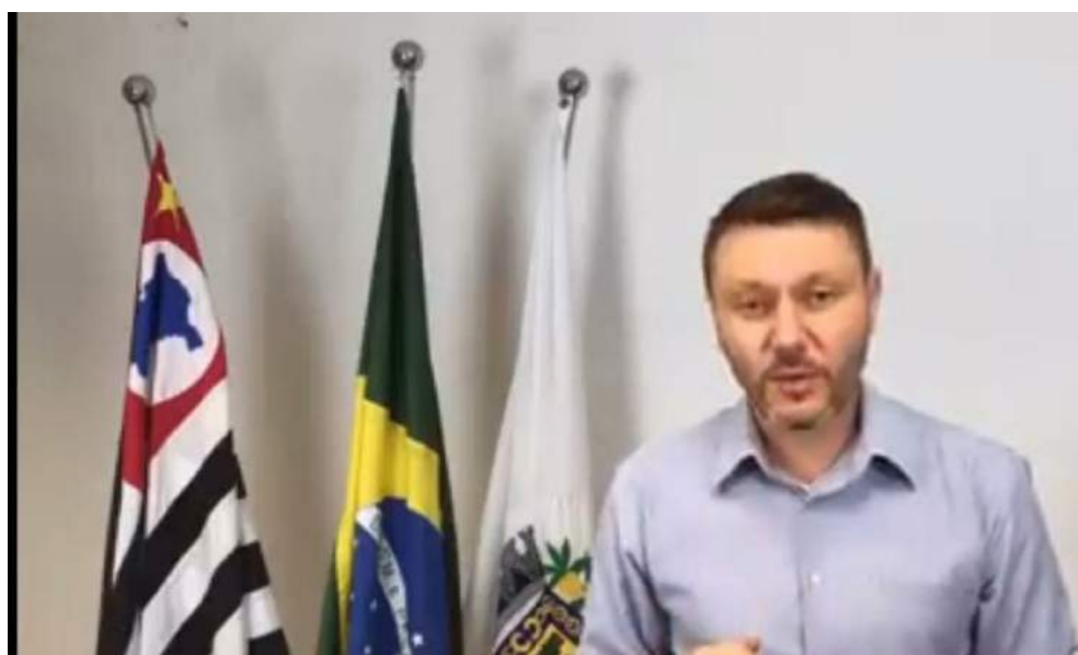
Prefeito Adriano Leite

“Estamos realizando diversas ações para reduzir a circulação de pessoas nas ruas e com isso impedir a disseminação do vírus. E a mensagem mais importante que a população precisa entender é: Fiquem em casa! Sabemos que não está sendo fácil, porém com calma e com ações individuais, vamos passar por esta fase”, disse o prefeito Adriano Leite.