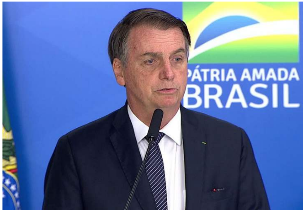
Presidente Jair Bolsonaro